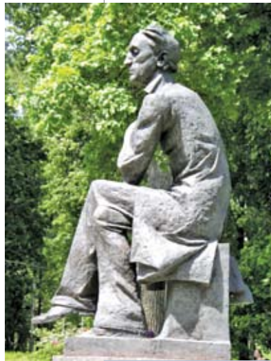
Памятник Федору Тютчеву в музее-заповеднике «Овстуг» (Брянская область)

А обратившись к некоторым замечаниям Федора Достоевского из «Дневника писателя» за 1877 год, мы видим, что, осуществив беспощадный и прагматичный (говоря нынешними категориями) анализ положения дел применительно к судьбам славянства, вполне бисмарковский по духу анализ, где присутствует трезвое понимание того, что сегодняшние союзники и братья завтра могут обмануть и бросить, великий писатель, тем не менее, подытоживает свои размышления следующим пассажем. Он пишет, что Россия «должна жить высшей жизнью, светить миру великой, бескорыстной и чистой идеей, воплотить и создать великий организм братского союза племен, создать этот организм не политическим насилием, не мечом, а убеждением, примером, любовью, бескорыстием, светом...» [3, с. 369]. Подобного рода настроения, призывы – это характерная часть русской идеалистической философской мысли конца XIX – начала XX века в целом. Приоритет этических конструкций – это элемент и социальной психологии, и философии, и