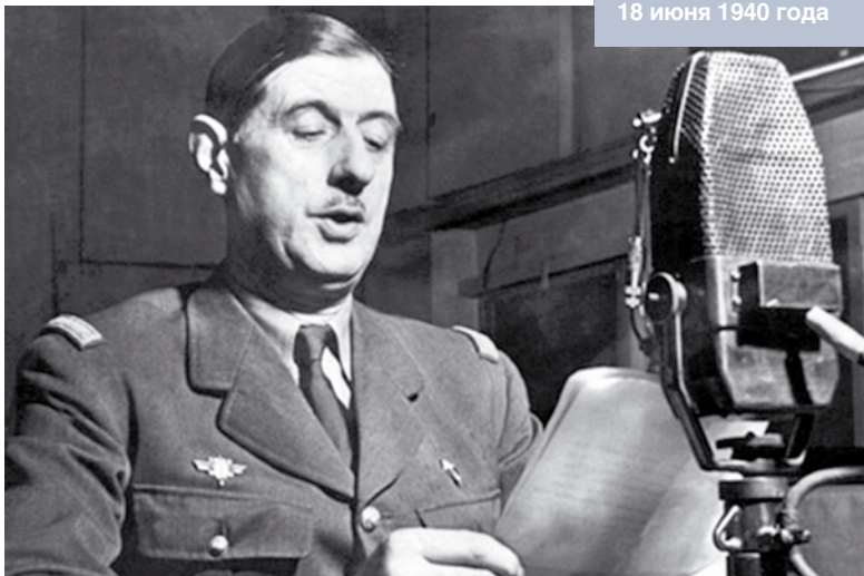
Глава комитета «Свободная Франция» Шарль де Голль выступает на радио Би-Би-Си с призывом к своим соотечественникам не складывать оружия. Лондон, 18 июня 1940 года

Попробуем первоначально соотнести категории «исторический выбор» и «моральный выбор». С точки зрения формальной логики возможен вариант, который традиционно называется «пересечением объемов понятий». Иначе говоря, выбор может быть одновременно и моральным, и историческим, а может и не быть таковым. Уинстон Черчилль, принимая решение о сопротивлении немецкой агрессии в конце 30-х годов прошлого века, сделал выбор одновременно и исторический, и моральный. Тот памятник, который ему поставили благодарные потомки недалеко от Вестминстера, – подтверждение справедливости как того, так и другого. Петр Первый, принимая решение о строительстве города на Неве, осуществил, вне всяких сомнений, исторический