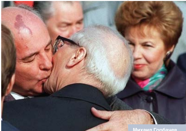
Михаил Горбачев прощается с Эрихом Хоннекером в аэропорту Берлина. 6 октября 1989 года

Чтобы подтвердить обоснованность этого тезиса, можно вспомнить и еще одну заметную политическую фигуру – М.С. Горбачева. Обратите внимание: на постсоветском пространстве сегодня большинство не может простить ему именно разрушение того общего национального дела, понимание которого сложилось в XX веке. Это дело – строительство, расцвет великого государства. М. Горбачев, возможно, правильно понимал общенациональную задачу, стремился к тому, что сегодня называют модернизацией и инновационным развитием, но его субъективное восприятие не нашло воплощения в практике государственного строительства. Скорее произошло обратное, что и определяет