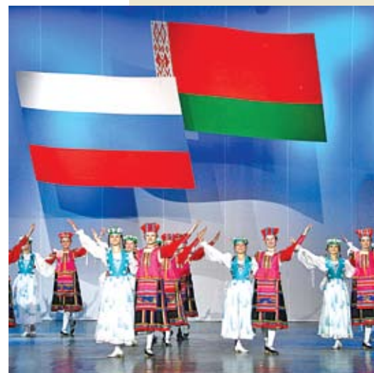
Праздничный концерт в Минске в День единения народов Беларуси и России