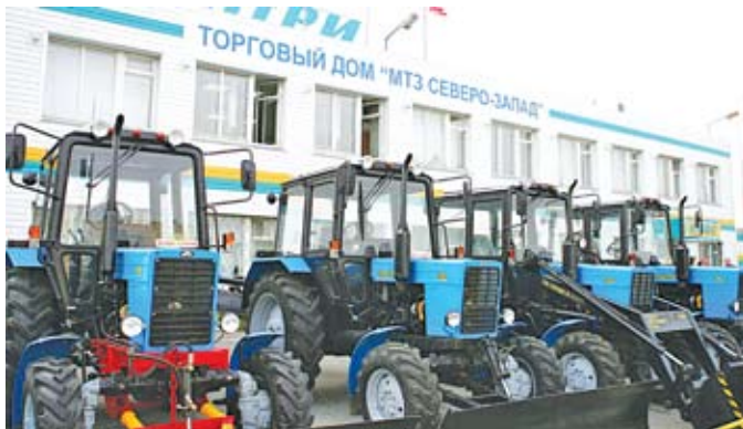
Торговый дом «МТЗ – Северо-Запад» в Череповце Вологодской области

Так, на прошедшем в октябре заседании Совета Министров Союзного государства рассматривался вопрос о ходе выполнения Программы согласованных действий в области внешней политики государств – участников Договора о создании Союзного государства на 2008–2009 годы. Программа представляет собой документ концептуального характера, который обеспечивает выработку согласованных подходов Республики Беларусь и Российской Федерации к наиболее важным проблемам международных отношений и координацию усилий наших стран во внешней политике. В рамках реализации Программы продол-