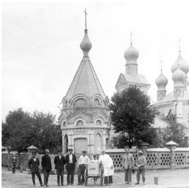
Гандляр марожаным каля Казанскай царквы ў Давыд-Гарадку. 1930-я гады

Асобную групу складалі агенты, тыповыя пасрэднікі паміж аптовым і рознічным гандлем. Асноўнай іх задачай было павелічэнне абаротаў вытворчасці. Агенты падзяляліся на два тыпы: пасрэднікі і прадстаўнікі інтарэсаў якога-небудзь прадпрыемства. Паводле польскага заканадаўства, агентамі маглі быць толькі купцы. Паміж агентамі і купцамі абавязкова складаліся дамовы як на вызначаны, так і на нявызначаны час [20, арк. 2–4]. Агенты некаторых тэкстыльных фабрык, якія наведвалі дзяржаўныя ўстановы і органы мясцовага