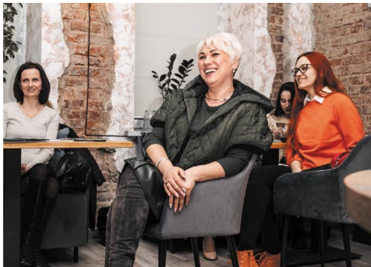
На заседаниях витебской ячейки предпринимателей всегда дружеская атмосфера

сплотились, чтобы противостоять информационным вбросам, поддержать Президента и страну. И разумеется, нам захотелось стать частью чего-то большего.