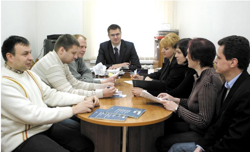
◀ Планёрка рэдакцыі часопіса «Беларуская думка». 2008 год

паперы. Атрымаўся знешне стыльны інтэлектуальны часопіс. Але ўжо занадта нефармальны. І тут, як той казаў, poblesse oblige... – стан абавязвае! У выніку – перамог калектыўны розум. Агульнымі намаганнямі белтаўскіх прафесіяналаў быў створаны дызайн – лаканічны, дастойны, з упэўненасцю і фундаментальнасцю думкі. Такі выгляд і меў часопіс амаль на працягу дзесяці гадоў. І толькі з 2017 года з’явілася новая вокладка.